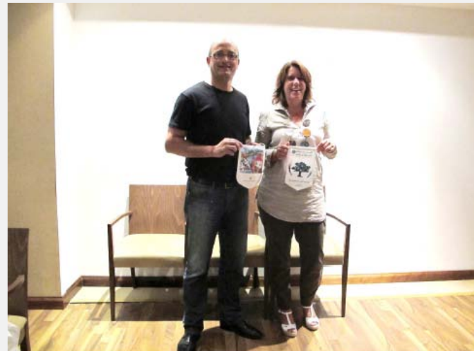
Fanion-Übergabe mit RC-Ramallah