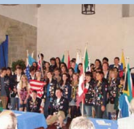
Country Fair 2010: