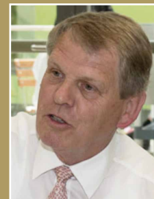
Paul Moeller Governor 2012/2013